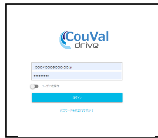
ログイン画面（イメージ）

コラボスペース （お客様用のフォルダがあるスペース）にアクセス お客様毎のフォルダ（4桁の番号を付与）のあるスペースです。接続元IPアドレス制御があるため、アクセスできるのは申請された御社ユーザ様と、NTTPCの御社担当のみのセキュリティを確保したフォルダをご提供します。